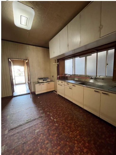
⑩1階ダイニング、キッチン