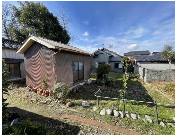
⑪家庭菜園スペース