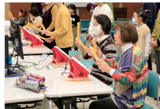
▲「太鼓の達人」を楽しむ参加者

大会は、今年度、高齢者向けのeスポーツ体験会などを開催してきた「かみいちゲームフルネスコンソーシアム」が、これまでの体験会(計10回の体験会には延べ約130人が参加)の成果を確かめられるようにと企画・開催し、「世代別ランキング戦」や「家族タッグトーナメント」などで老若男女を楽しませました。