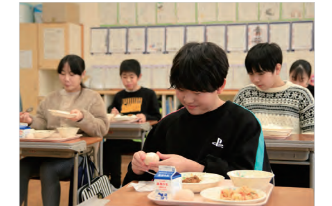
▲南極では、曜日感覚を失わないように金曜日は「カレーの日」と決まっているそう (この日は、ドライカレー)

伺った陽南小学校では、お昼の放送で給食委員の児童が、南極へ食材が運べるのは隊員が向かうタイミングの1度だけということなどを紹介していました。