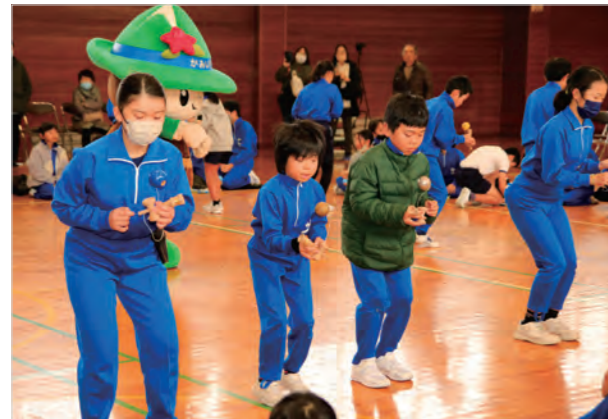
▲もしかめの部の様子 (この日の最高記録は716回)

大会では、大皿と中皿を往復させた回数を競う「もしかめの部」とけん玉チャレンジカードの10級の技から順に挑戦していく「技の部」が行われました。