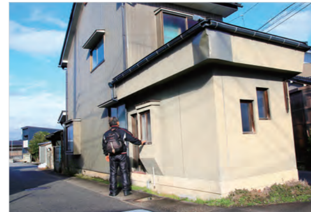
▲譲り受ける家を確認する男性

これから男性は、学習塾経営の経験を生かし、学習塾や子の放課後の見守りなどの事業を考えているといい、「いつまでもめそめそしてられない。命が助かってありがたかった。前を向いていきたい」と話しました。