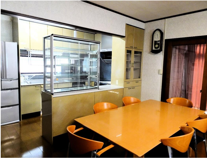
リビングダイニングキッチン