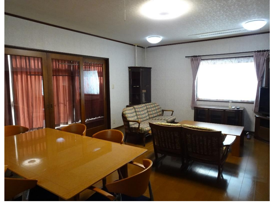
リビングダイニングキッチン