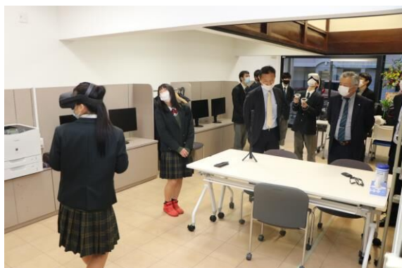
サテライトオフィスでのバーチャル技術体験