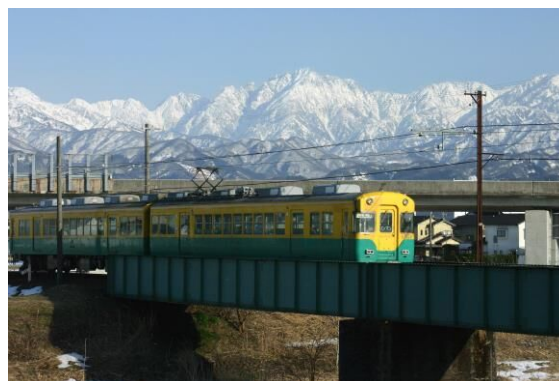
かぼちゃ電車と剱岳