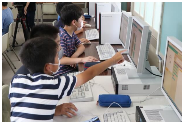
プログラミング学習