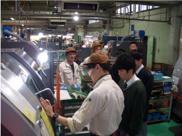
上市高校生の職場見学会