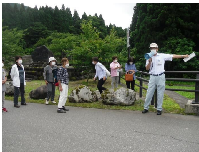
町民ふるさと学園