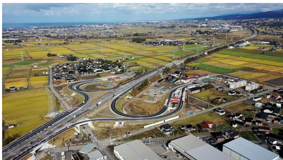
上市スマートインターチェンジ

大都市圏への若い世代の流出に歯止めをかけるために、デジタル技術の活用による雇用の創出や地域活性化を図るとともに、ひと・もの・しごとの流れを生むための基盤を整えて、上市町の特長を最大限に活かし、特産品開発や農業の担い手育成、移住・定住の促進を図るなど、にぎわうまちづくりに向けた取組にチャレンジします。