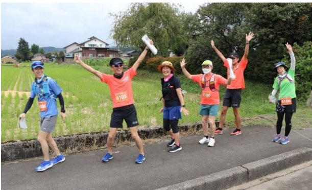
フォトログейニング