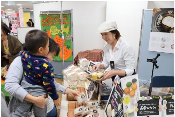
創業支援チャレンジショップ事業