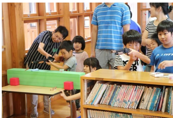
こどもの城・城まつり

人口減少や少子化、核家族化といった状況が見られるなか、子育て家庭の不安や負担感を軽減する取組を充実させ、希望通りの結婚ができ、妊娠・出産・子育てと切れ目なく支援するほか、学校、各種団体とも連携しながら教育環境の充実を図るなど、ミライへつながる人づくりを推進します。