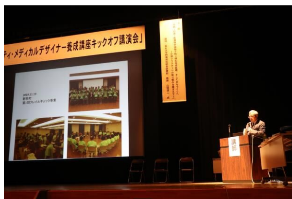
コミュニティ・メディカルデザイナー 養成講座