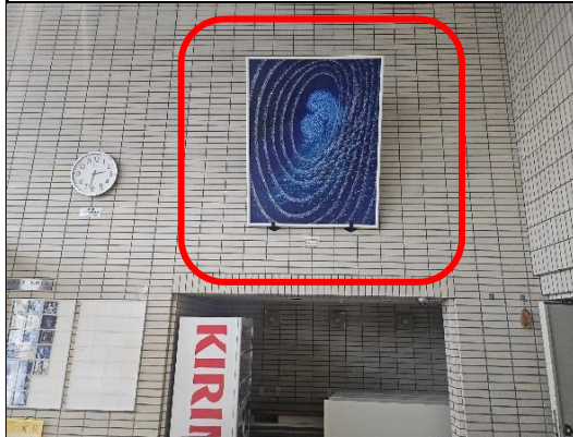
(B)エントランスホール右側上面