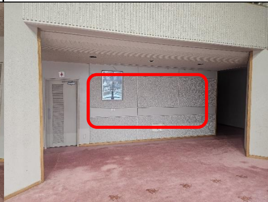
(B)2階ホワイエ女子トイレ右側