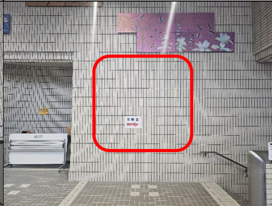
(B)エントランスホール正面階段前