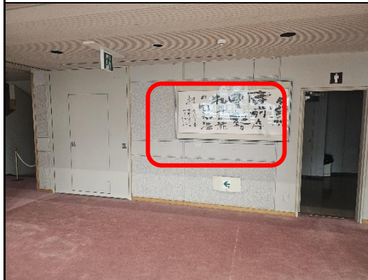
(B)2階ホワイエ男子トイレ左側