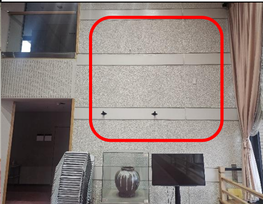
(B)2階ホワイエ奥上面