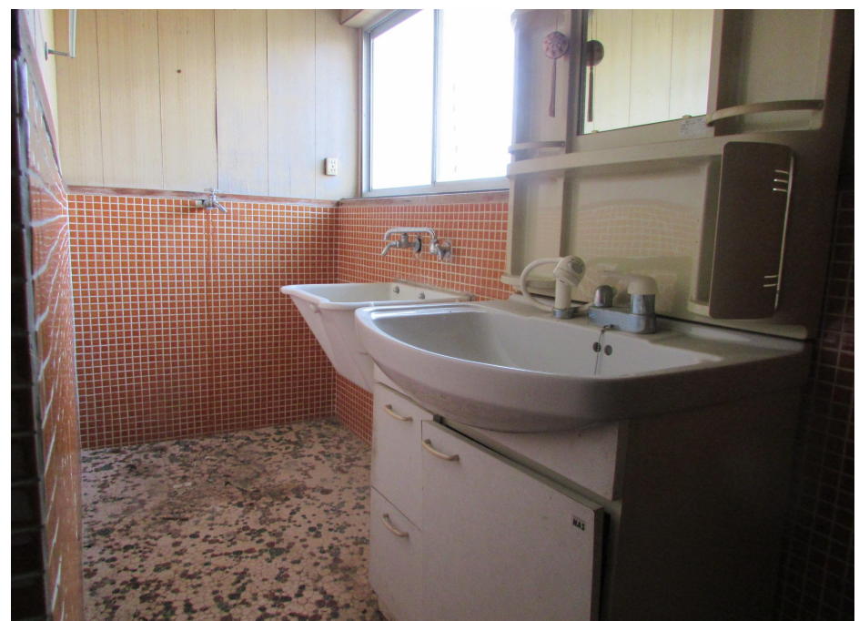
内観(1階洗面・洗濯室)