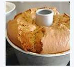
たべる - おやつ屋 きなこまる

「クロモジおやつ」 クロモジの爽やかな香りをまとったクロモジおやつをお楽しみ下さい。(国産小麦・きび砂糖・米油使用)