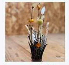
かざる - gokoti ごこち

「ワークショップと販売」 クロモジの枝から作る飾り物。香りを楽しみながら作ります。 〈ワークショップ〉 ・クロモジランプ ・クロモジとお花のオブジェ ・クロモジサシェ 【受付】当日受付 ※各価格は現地にてご案内 〈販売〉 ・クロモジリース ・スワッグ ・ブーケ