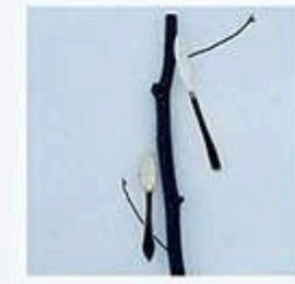
けずる - tocotoco

「クロモジカトラリー作り」 クロモジの生木をナイフで削り、ゆったり楽しむものづくりの時間です。 【開催時間】①10:30~12:30 ②13:30~15:30 【各回定員】5名 【参加費】¥2,000 【受付】要予約 ※写真はイメージです