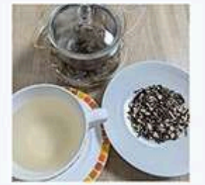
のむ - Teeglich

「樹木で作るお茶」 クロモジの爽やかな香りに利質の森に生きているスギやマツなどの野生味が加わり、森の香りがするお茶になりました。