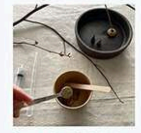
かぐ - 植物屋 ヨアケマエ

「クロモジのお香づくり」 上市町で採取したクロモジと白檀を使ったお香作り。スティック型・コーン型をお選びいただけます。 【開催時間】 ①10:30 ②11:30 ③13:00 ④14:00 ⑤15:00 【各回定員】4名 【参加費】¥1,000/回 【所要時間】15~30分程度 【受付】当日受付