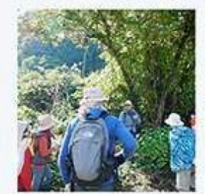
さがす (フィールドワーク) - 池田アキ / 有峰自然観察指導員

「クロモジを探せ」 クロモジを見つける、小さな旅。枝の特徴、香りなどを手がかりに、実際の姿を観察しながらクロモジを探しに出かけます。 【開催時間】 ①10:15~11:15 ②11:30~12:30 ③13:30~14:30 ④14:45~15:45 【受付】当日受付 ※詳細は現地にてご案内 ※写真はイメージです