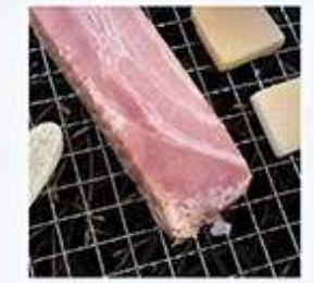
いぶす - tocotoco

「クロモジ燻製実験」 精油の抽出など「香木」として有名なクロモジですが、クロモジを使った燻製はどんな香りと味わいが生まれるのでしょうか。 【受付】当日受付 ※詳細は現地にてご案内 ※写真はイメージです