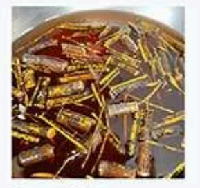
そめる - starry-eyed (監修)

「クロモジ染め」 クロモジを染料に用いて手拭いを染めるワークショップです。クロモジがもつ自然の力と、染めの魅力をお楽しみ下さい。 【受付】当日受付 ※詳細は現地にてご案内 starry-eyed さん 製作のクロモジ染めアイテムも販売予定