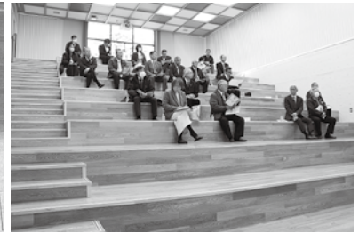
階段状の多目的ホール