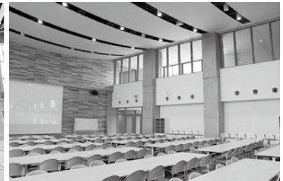
多様なイベントに対応できる広さのランチルーム

水橋学園はグラウンドも広く広大な敷地に建設されており、細部にわたりこだわりが感じられる設計であった。一方、上市町においては現上市中学校の敷地に建設が予定されており、水橋学園のようなゆとりある空間構成や多様なスペースを確保することは困難である。しかしながら、特別教室や多目的スペースなど教育環境の充実に不可欠な機能については、優先的に確保していく必要がある。限られた敷地条件の中で如何に効率的な配置を実現するか、今後の基本設計において十分な検討が求められる。