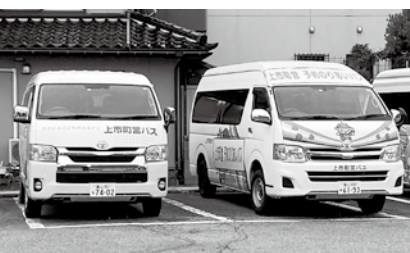
予約のりあいバス