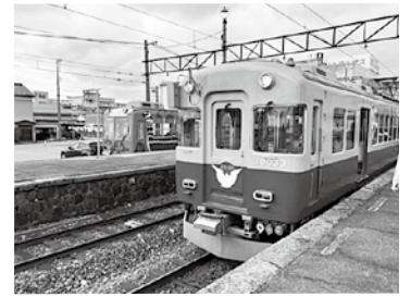
富山地方鉄道の電車

県と地鉄及び沿線7市町村で令和8年度の富山地方鉄道鉄道事業における収支差を3分の1ずつ負担し、2億円は沿線7市町村負担の額で、当町負担分はそのうち約5%となる。なお、沿線7市町村の負担割合は、列車走行キロと標準財政規模で案分して算出したものである。