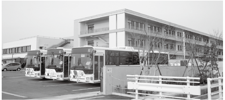
義務教育学校「水橋学園」

体育館はアリーナ1とアリーナ2の2面構成でいずれも冷暖房設備を完備。ランチルームは開放感があり多目的イベントにも対応可能。図書館は2層吹き抜けの開放的な空間で、上級生と下級生の交流に利用できる。