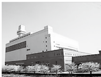
富山地区広域圏クリーンセンター

町長 生ごみのたい肥化は、現在もコンポストや生ごみ処理機の購入に対し補助制度を設けており、EM菌を使用したコンポストも補助対象としている。