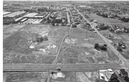
令和7年4月造成工事着工前