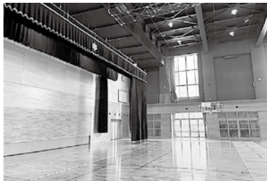
上級生が使用するアリーナ2