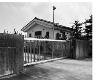
神田浄化センター