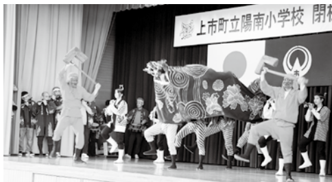
陽南小学校の閉校式に獅子舞を奉納

議員 3月7日に行われた陽南小学校の閉校式では、32年ぶりに柿沢祭り会の皆さんによる獅子舞が奉納された。先行統合する陽南小学校の子ども達が、少しでも早く義務教育学校に通えるよう願う。