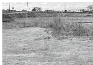
増えてきている遊休農地