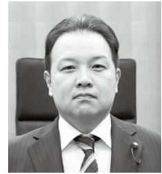
廣田 透 議員