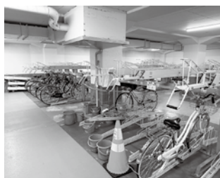
上市駅地下駐輪場