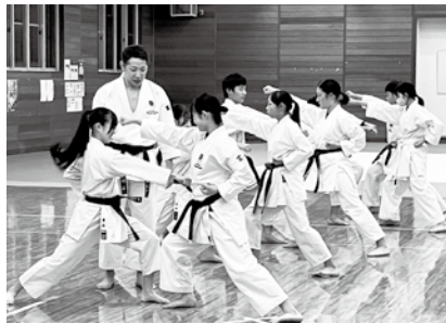
地域クラブの活動

われる。このため、企業スポンサーに関心をお持ちの企業がいらつしゃれば、お話しさせていただき、どのような形で支援をお受けできるのか、企業の皆様にとどのようなメリットを提示できるかを協議・検討していきたい。