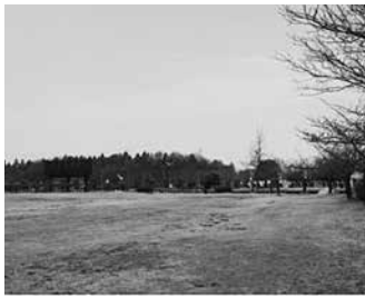
丸山総合公園芝生広場

この管理費は指定管理者への委託料であり、施設管理や人件費を含んでいる。現場の状況を見ながら対処したい。