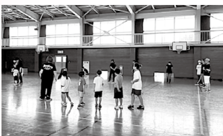
体育館での活動の様子

今後温暖化が進行し、状況の悪化が見込まれる場合においては、何らかの追加の対策も検討していく。