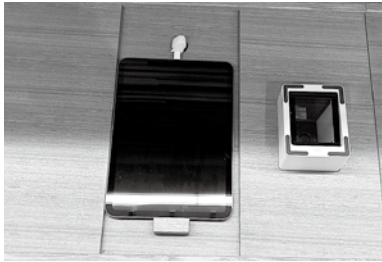
情報管理システムとICリーダー